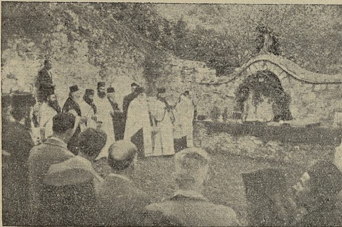
Τέλεσις Ἀγιασμοῦ κατὰ τὴν λιτανεῖαν τῆς δευτέρας ἡμέρας τοῦ Πάσχα ἐν τῇ Ἱερᾷ ἡμῶν Μονῇ.

Ἡ Ἱ.Δ.Σ. λαβοῦσα ὑπ' ὄψιν ὅτι ἡ Ἑκτακτος Διπλή Ἱερὰ Σύναξις ὑφίσταται ἀνά τοὺς αἰῶνας, ἀρχῆς γενομένης ἀπὸ τοῦ ἔτους 972 ὅτε συνειτάγη τὸ πρῶτον τυπικὸν τοῦ Ἁγίου Ὁρους καὶ ἐν συνεχείᾳ, συνερχομένων τῶν Ἠγουμένων καὶ Προϊσταμένων τῶν Ἱ. Μονῶν μετὰ τῆς